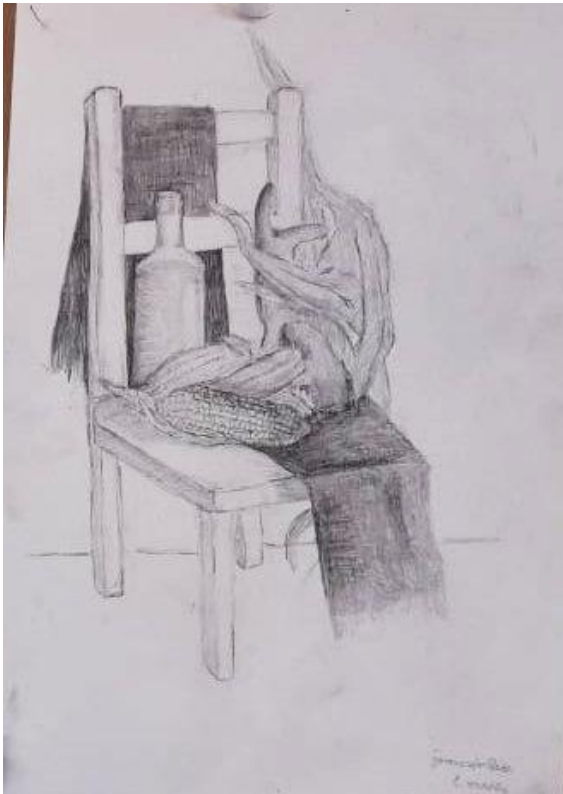
Gerencsér Réka grafikája

Köszönjük minden támogatónak a felajánlásokat!