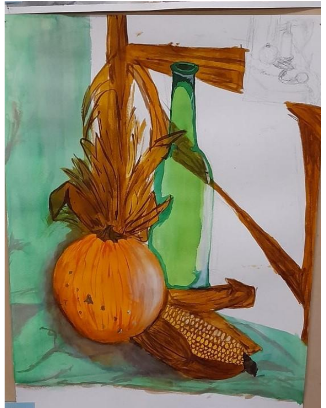
Balogh Nóra festménye